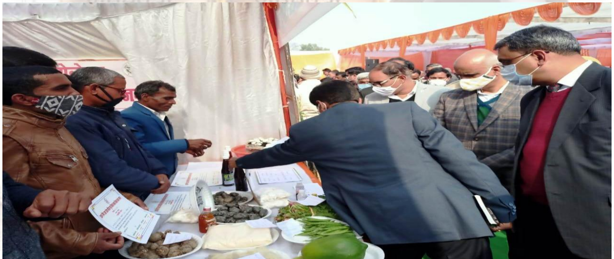
District Administration and distinguish dignitary's considered their products during U P Diwas